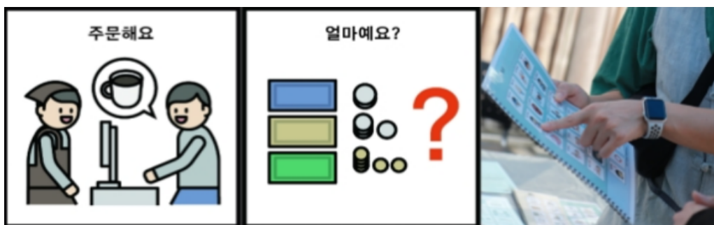
〈의사소통 도움 그림글자판 활용 예시〉